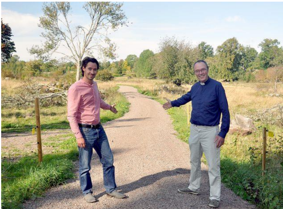
Representanter från samhällsförening och markägaren (Svenska kyrkan) visar den nyligen anordnade gång- och cykelvägen till Välenbadet, en frukt av ideella ansträngningar. INNEHÅLL

Utbyggnadsområden i ÖP har inte genomförts. Gång- och cykelväg ner till pendelhållplats inte utbyggd, vilket blir ett större behov om tätare busstrafik införs. Det finns en regional ambition att utveckla lokala knutpunkter med pendelparkering i de starka busstråken. Kopplingen mot Åseda/Växjö blir allt viktigare, särskilt för den västra kommundelen.