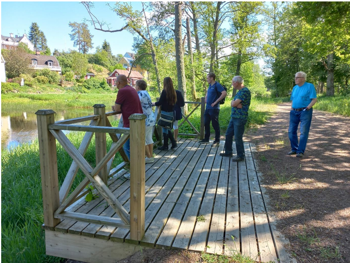
Dialogvandring kring Lanhagens utveckling, vid Emån.