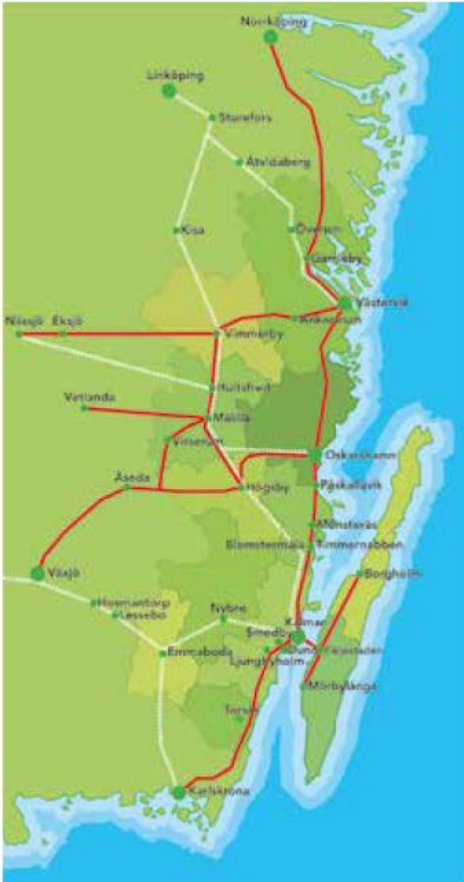
Översiktskarta över kollektivtrafikstråk, vita linjer visar järnväg, röda ett expressbussnät av BRT-typ (Bus Rapid Transport). Utdrag från Regional transportplan för Kalmar län, 2018-2029.