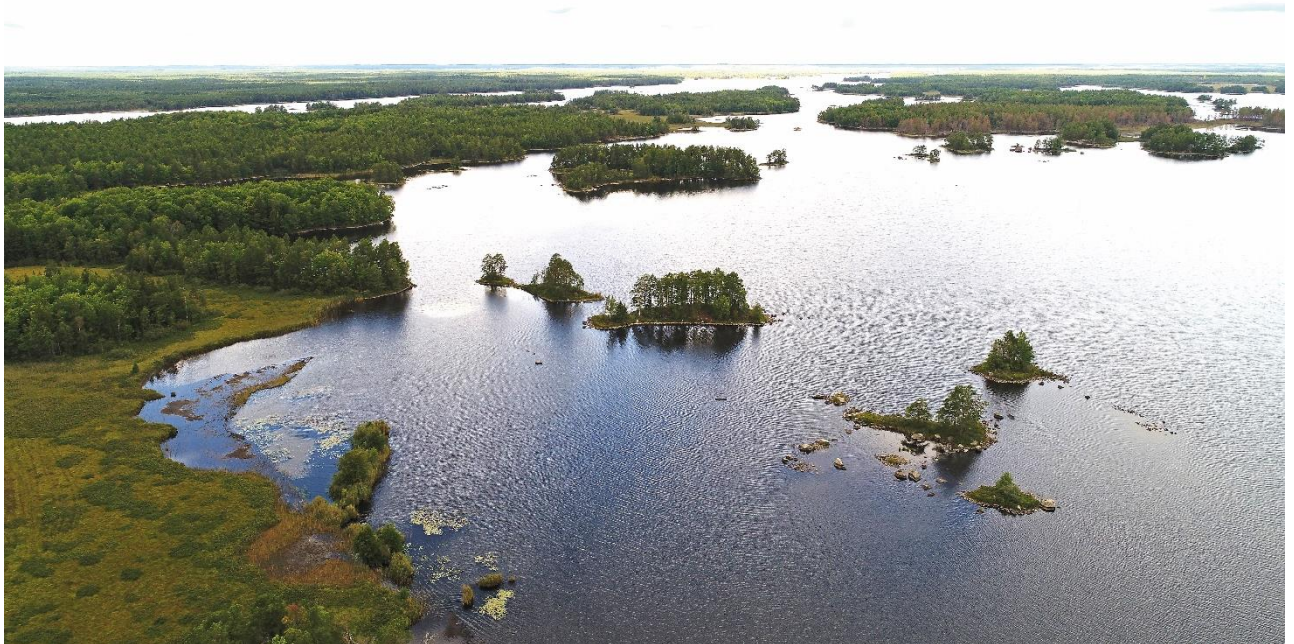
Flygfoto över Allgunnen, ett område där nationalpark diskuteras!