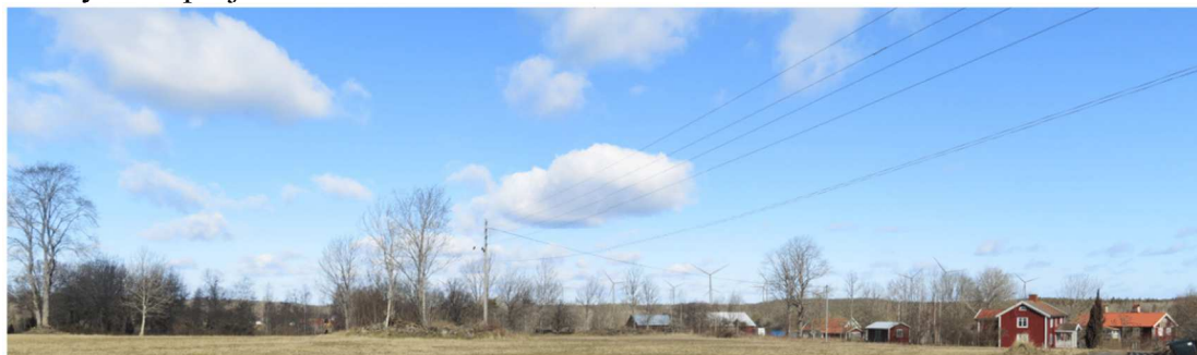
Fotopunkt Axebo: Exempellayout med 16 vindkraftverk och totalhöjd 270 m, närmaste verk: ca 3300 m.

Det är möjligt för föreningslivet även inom Högsby kommun, i närområdet, att söka så kallad "Vindbonus" med stöd för projekt som bidrar till bygdens utveckling. I övrigt så är det vindbolaget och berörda fastighetsägare där vindkraftverken står, i Hultsfreds kommun, som drar direkt ekonomisk nytta av projektet.