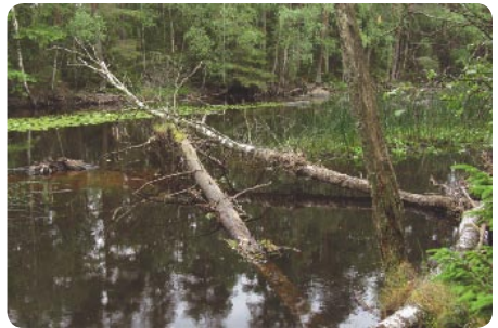
Exempel på vattendrag med död ved i olika åldrar. Den nedre bilden är från Trässhults kanal, Tingsryd kommun som visar död ved både på land och i vattnet.