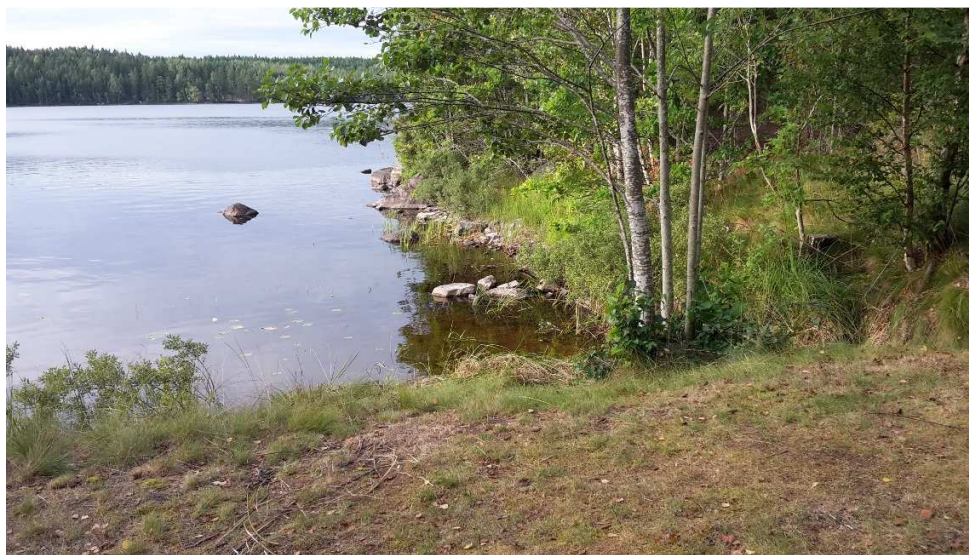
Den naturliga badplatsen vid sjön.

Den sökande bedriver turismverksamhet på fastigheten genom att hyra ut stugor och tillhandahålla natur-, fiske- och upplevelseturism.